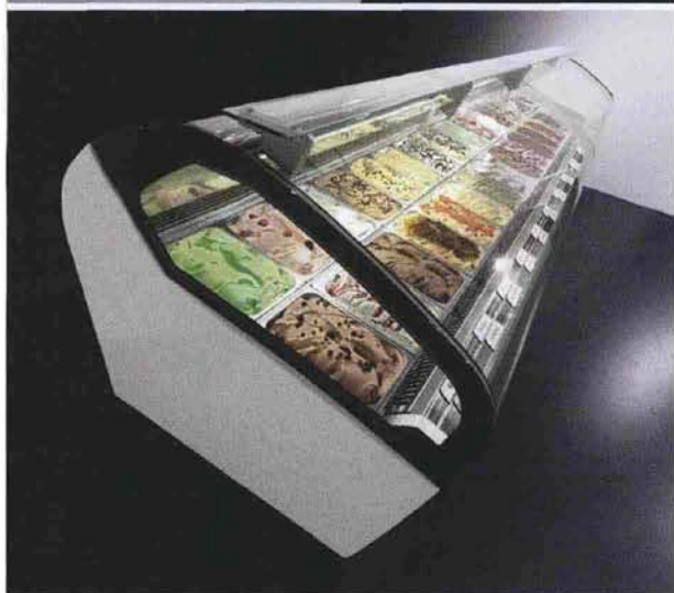
In cover, Giampaolo Allocco e Ninja, seduta in polimero tecnico disegnata per Gaber. Sopra, Lunette, nuova vetrina per gelati con frontale Total View, disegnata per Ifi Industrie (gennaio 2011). A destra, Ortus, servetto in ceramica disegnato per Bosa Ceramiche.