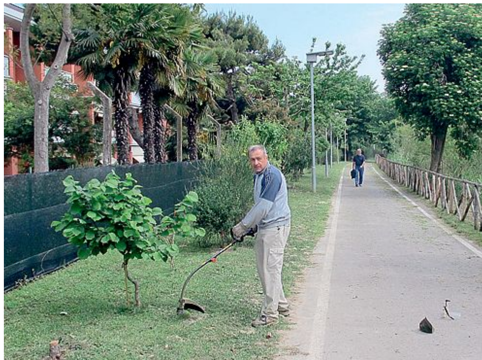
PRIVATI E VOLENTEROSI La pista all'inizio della Tombaccia: i residenti, nonostante si tratti di terreno pubblico, lo curano con estremo amore come se fosse il loro giardino