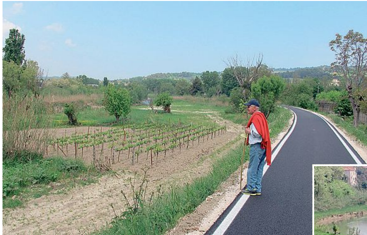
LA DOVE C'ERA L'ERBA... Ora c'è una vigna. A destra, il fiume in centro: natura e città

LA NUOVA ciclo-pedonale del Foglia, un atto di mecenatismo della Ifi che l'ha finanziata (300.000 euro), fatta realizzare e donata al Comune, è come una finestra sul cortile nascosto: il fiume percorso dall'interno, con i suoi angoli insoliti e presenze insospettite, la città vista dall'argine che diventa sfondo, il traffico tenuto a distanza di quel tanto da far compatire chi ne è prigioniero. Il primo tratto, da Ponte Vecchio fin nei pressi del ponte della ferrovia, è quello già realizzato in precedenza: 330 metri che già propongono un modello di gestione. Tre residenti di via Spoleto presta-