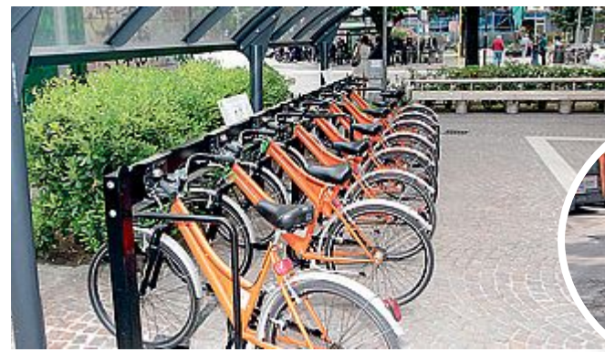
INUTILIZZATE Le bici in piazzale Matteotti. Sotto piazza stazione