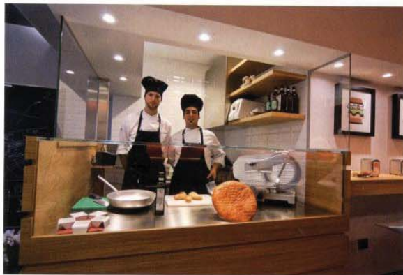
gli chef dell' Altro Caffè