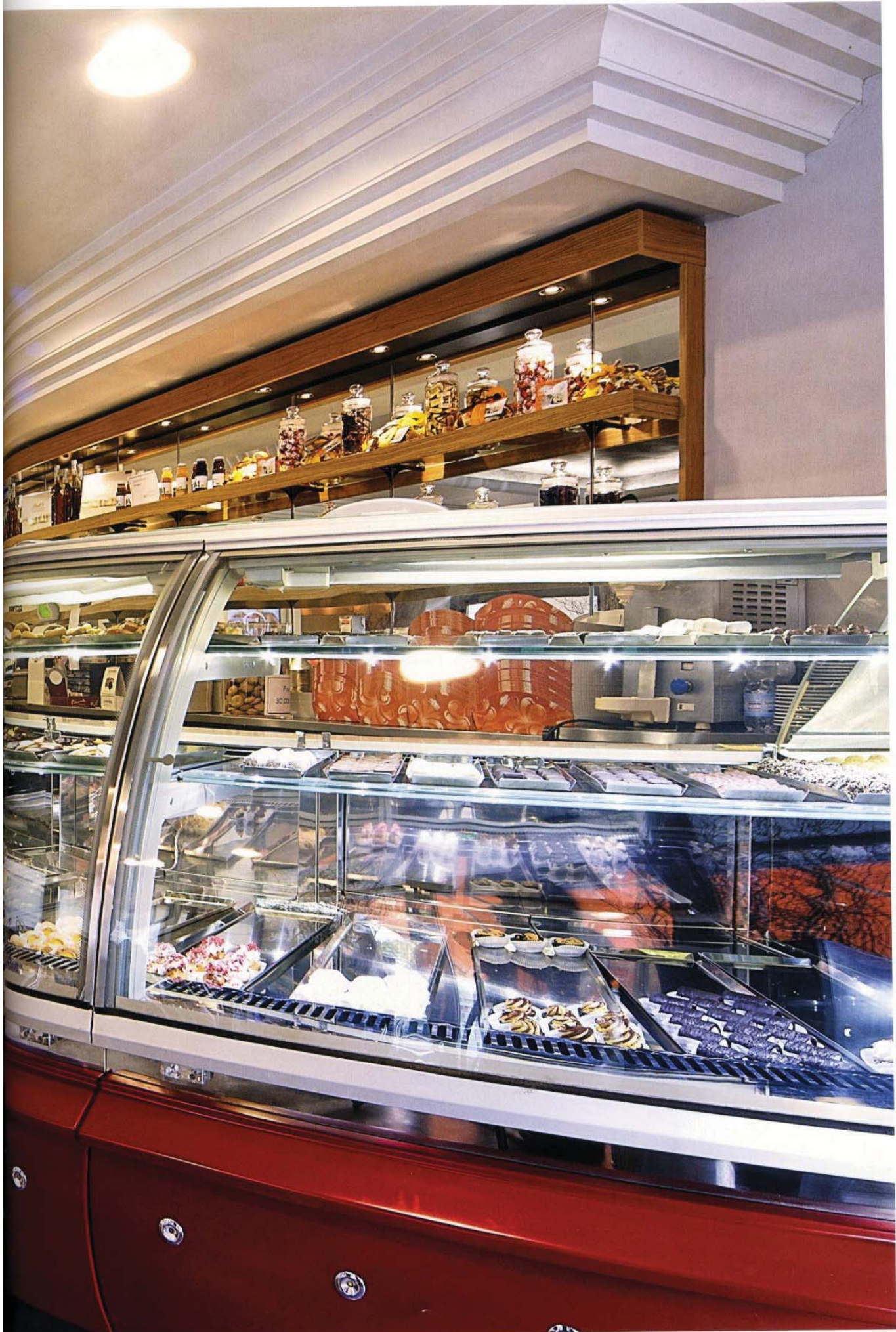
Progetto a cura del Designer Roberto Garbugli (Pesaro) www.garbugli.com