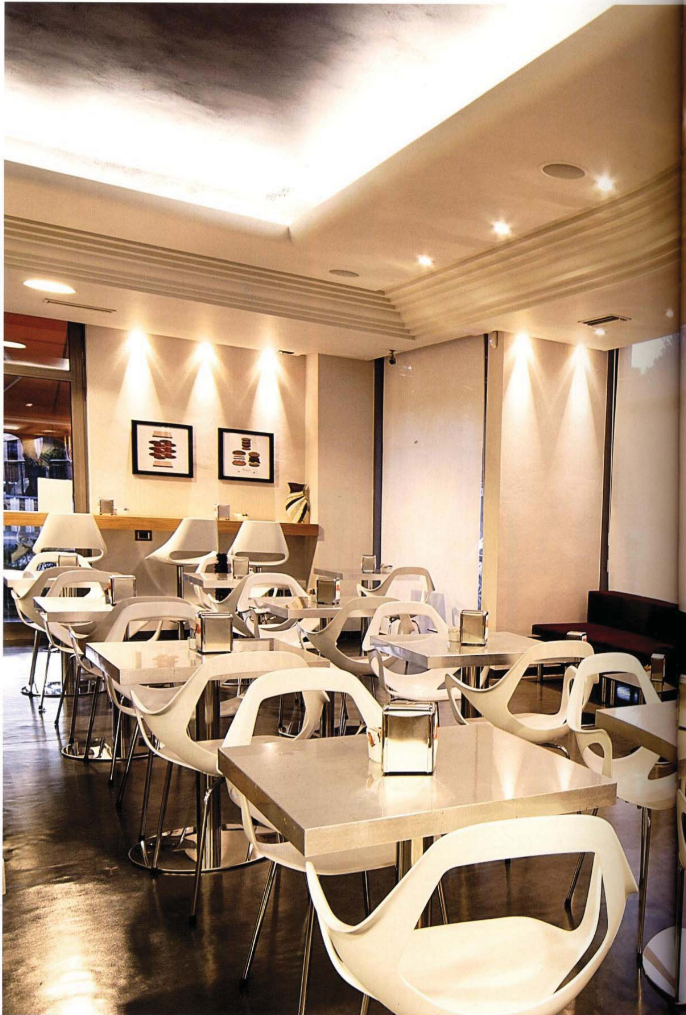
Progetto a cura del Designer Roberto Garbugli (Pesaro) www.garbugli.com