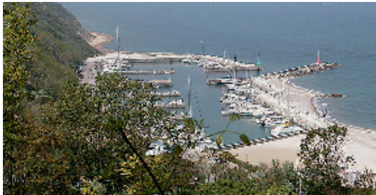
CASUS BELLI Una immagine del porto della Vallugola