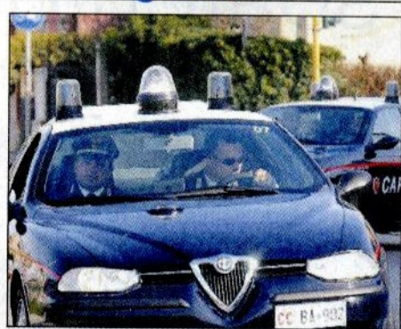
Indagini dei carabinieri

Droga a Baia Flaminia Presi mentre spacciano cocaina ai ragazzini