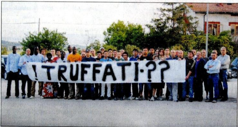
I lavoratori della Dreaming protestano con uno striscione, un assaggio delle più eclatanti forme di protesta annunciate nel corso dell'assemblea. La crisi della nautica si sta facendo sempre più preoccupante e il Fanese e la Valcesano ne stanno risentendo

«Pronti a manifestare duramente davanti alla sede dell'azienda nautica»