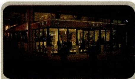
LA CAFFETTERIA, GELATERIA, CREMERIA ADLER