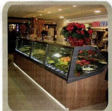
LO YOGURT A MESTOLO, LA FRUTTA FRESCA E I GELATI DI ADLER NELLE VETRINE CUBIKA DI IFI

Oltre alle vetrine gelato, ai componenti dei