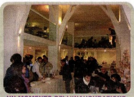
UN MOMENTO DELL'INAUGURAZIONE

Tutto è cominciato nel sessantotto in una città tra le più autorevoli candidate a