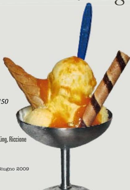
Gelateria King, Riccione

latte g 2.000 zucchero g 750 panna g 750 tuorli g 500 marsala o zibibbo g 550 maltodestrine g 175 latte in polvere magro g 150 inulina g 100 addensante g 25