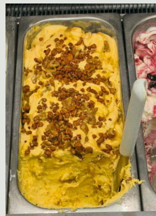
Gelateria Le Delizie, Santarcangelo

Aggiungere alla base le paste; all’uscita dal mantecatore variegare con croccante di mandorle in abbondanza tra gli strati; decorare con mandorle pralinate e croccanti.