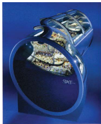
Space 2 di Ciam.