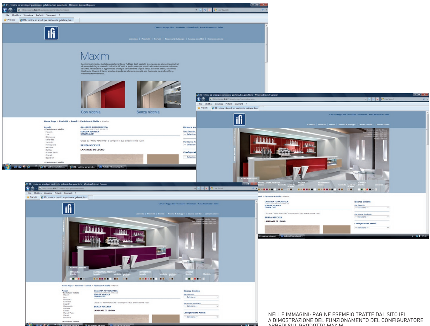
NELLE IMMAGINI: PAGINE ESEMPIO TRATTE DAL SITO IFI A DIMOSTRAZIONE DEL FUNZIONAMENTO DEL CONFIGURATORE ARREDI SUL PRODOTTO MAXIM.

GRANDE SUCCESSO PER IL CONFIGURATORE ARREDI SUL SITO IFI! SEMPRE PIÙ PERSONE SI CIMENTANO CON IL NOSTRO CONFIGURATORE (VEDI IFI NEWS SETTEMBRE 2009), UNA NOVITÀ ASSOLUTA PER IL SETTORE, CHE PERMETTE ALL'UTENTE DI SCEGLIERE ONLINE I COLORI O LE ESSENZE DEGLI ARREDI E DI VEDERLI CAMBIARE SOTTO I PROPRI OCCHI.