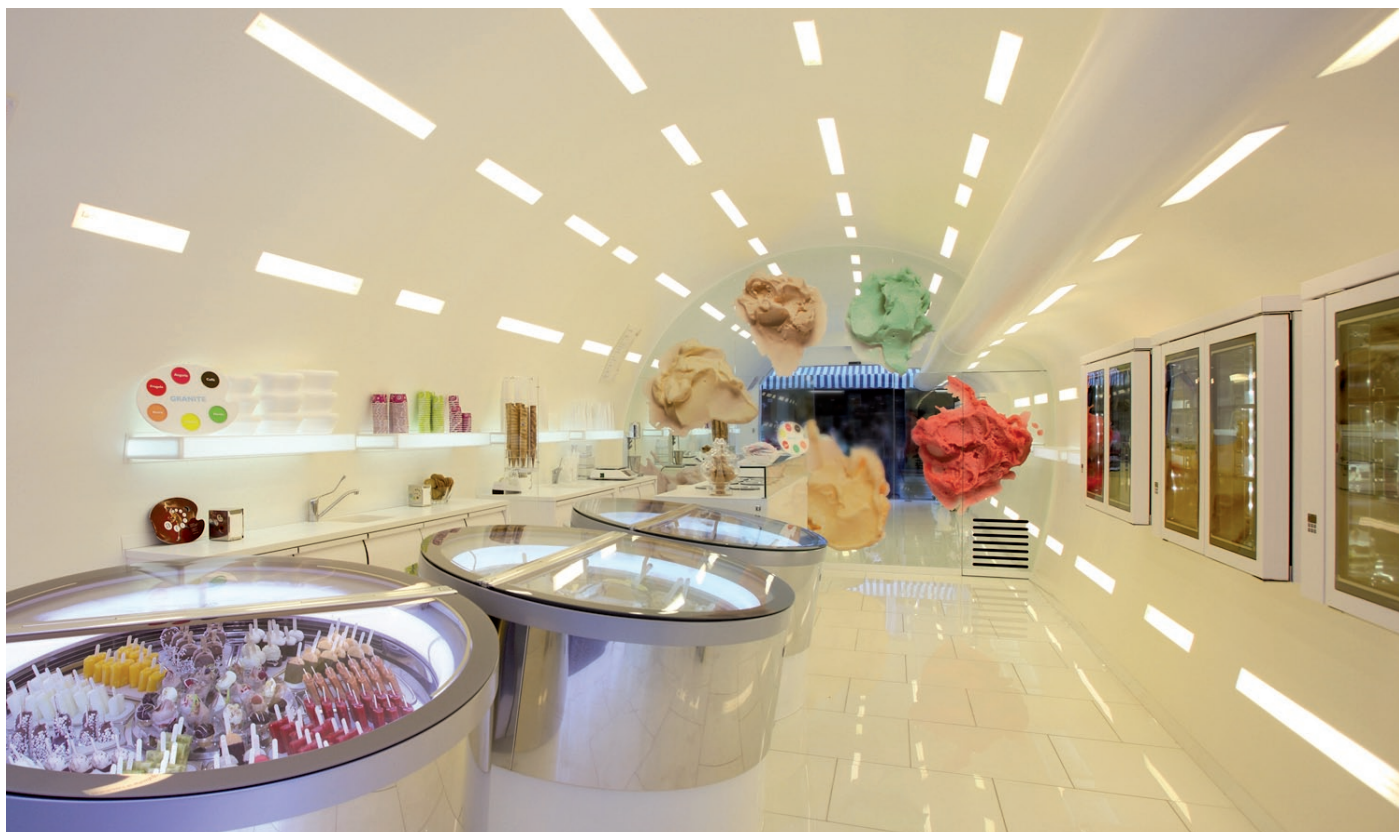
NELL'IMMAGINE: ECCO COME SI PRESENTA IL LOCALE OGGI, CON L'INTEGRAZIONE DELLA TERZA VETRINA TONDA.

Affresco by Giotonda è un perfetto esempio delle diverse espressioni di Affresco, il nuovo concept di gelateria di design che rivoluziona con un colpo di pennello l'immagine classica della gelateria, in uno spazio raffinato a forma di tavolozza. Opera di un grande designer di locali pubblici e di intrattenimento, Beppe Riboli , in collaborazione con NABA ( la Nuova Accademia di Belle Arti di Milano ), Affresco è un sistema d'arredo completo, flessibile e personalizzabile, studiato in ogni minimo dettaglio grazie a un pool di competenze che spaziano dall'arredo, alla tecnologia, ai complementi. Il tutto a cura di IFI, azienda leader nell'arredo di locali pubblici e nella cultura del design applicata alla refrigerazione. Il luogo ideale dove incastonare e sottolineare tutto il prestigio di un simbolo italiano amato in tutto il mondo, il gelato artigianale, interpretato da ogni singolo gelatiere, con i suoi piccoli e grandi segreti, unici come la sua passione.