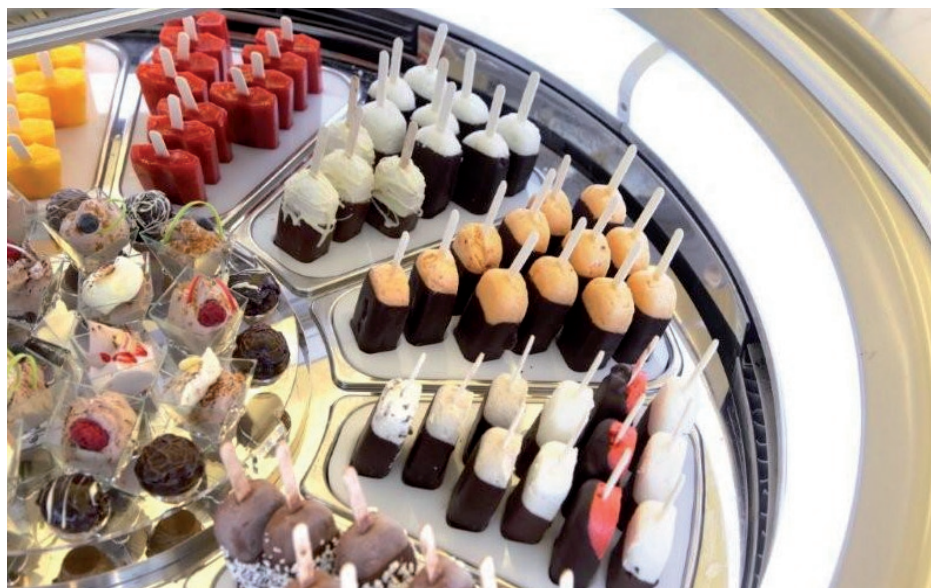
NELLE IMMAGINI: FOLLA POMERIDIANA DAVANTI ALL'INGRESSO; IL BANCO A POZZETTI PER LE GRANITE; IL MOMENTO DEL GELATO; NEL LABORATORIO SI LAVORA SENZA SOSTA; I BAMBINI OSSERVANO RAPITI COME NASCE IL GELATO; UN PARTICOLARE DELLA VETRINA TONDA DEDICATA AI GELATI SU STECCO E AI GHIACCIOLI.