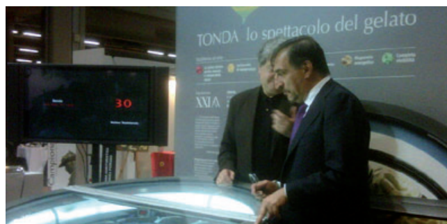
Milano. Il Ministro della Difesa, On. Ignazio La Russa, e il Presidente della fondazione Symbola Ermete Realacci osservano attentamente la vetrina gelato Tonda di IFI S.p.A., icona internazionale del design applicato alla tecnologia. Tonda, la prima vetrina rotonda e rotante della storia, è un prodotto 100% made in Marche, progettato, realizzato e prodotto negli stabilimenti di Tavullia (PU), e diffuso in più di 40 Paesi nel mondo.