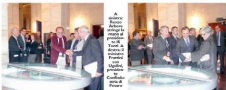
A sinistra: Renzo Arbreo stringe la mano al presidente Ifi Tonti. A destra: il ministro Frattini con Ugoletti, presidente Confedustria di Pesaro

Si tratta di una vetrina-gelato delle industrie marchigiane Ifi. Studio di Provinciali